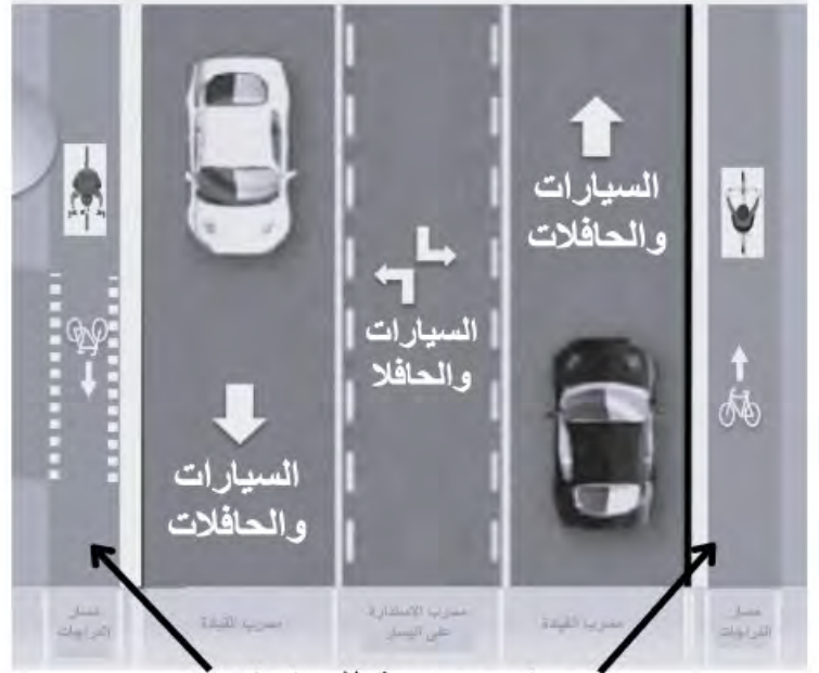
مسارب جديدة للدراجات

زوروا الصفحة الخاصة بحملة "أنقذوا شارع BLOOR" على الويب على عنوان www.ApplewoodHHRA.com للاطلاع على مزيد من المعلومات ومن أجل تنزيل التماس للتوقيع عليه.