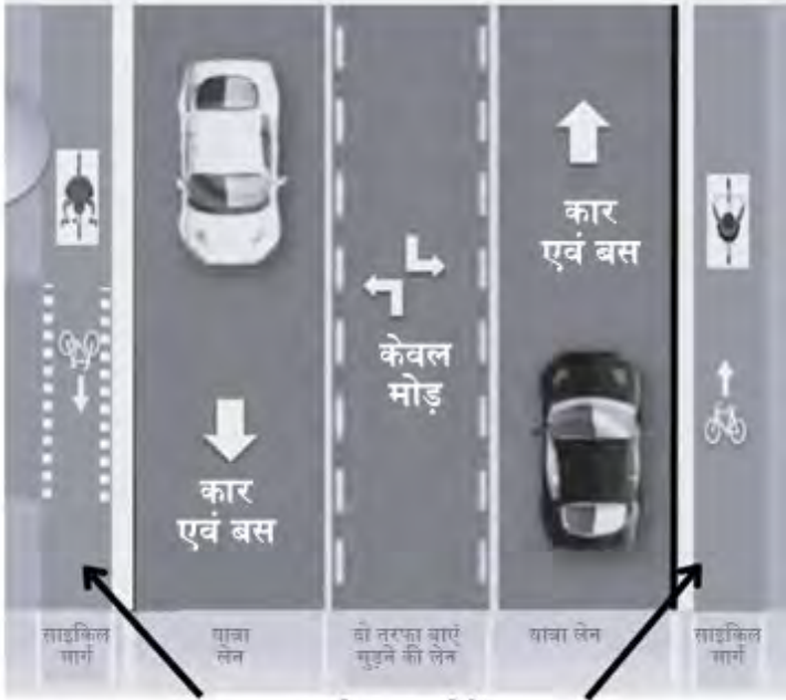
नई बाइक लेनें